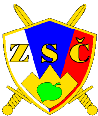
Območno združenje slovenskih častnikov Velenje