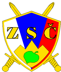
Območno združenje slovenskih častnikov Velenje